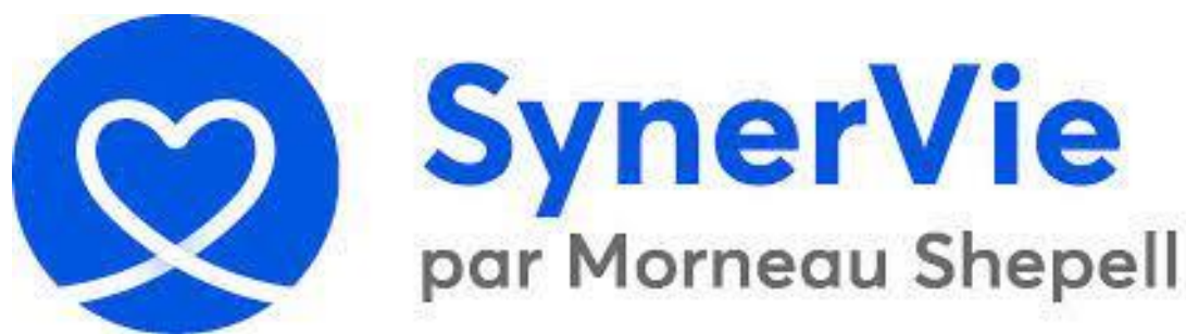
Plate-forme LifeWorks SynerVie (cliquez sur l'icône pour accéder au site complet)